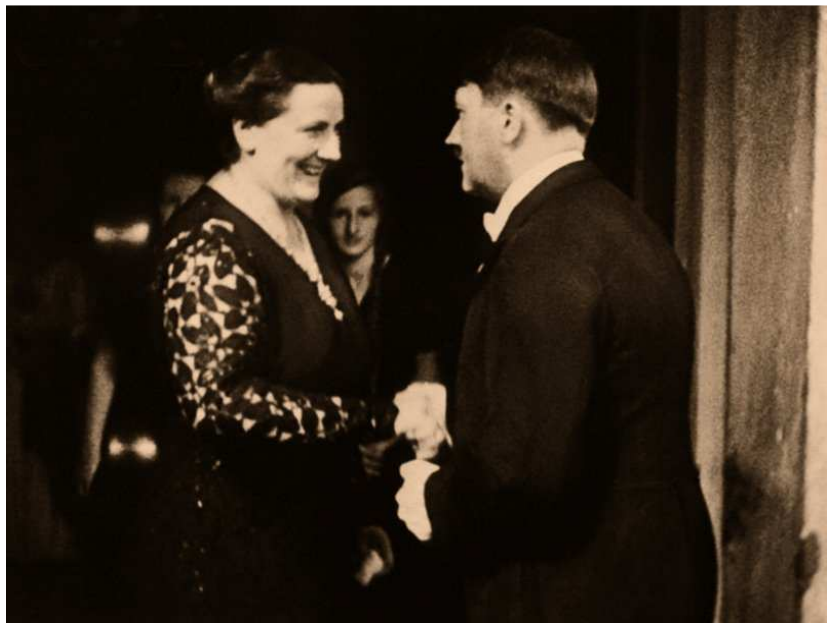
Winifred Wagner et Adolf Hitler