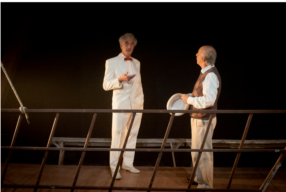
Casablanca '41. Le Pot au Noir, Saint-Paul-lès-Monestier, septembre 2015.